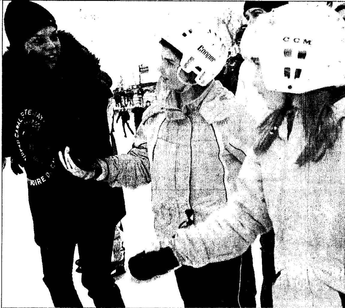
FTIENNE RANGER, Le Droit