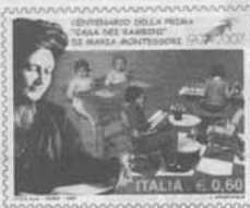
Timbre émis par Posteitaliane en janvier dernier à l'occasion du 100 e anniversaire de l'ouverture de la première école Montessori.

La pédagogie Montessori prône le développement total de l'enfant. Elle a pour but de l'aider à devenir un individu responsable et sensible à son environnement, adapté à son époque et à sa culture.