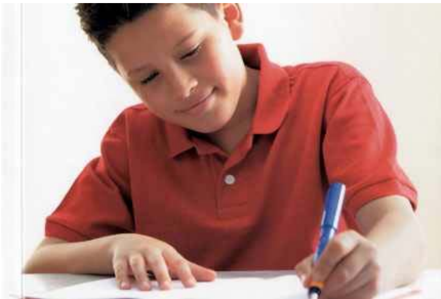
Photo tirée du livre Un enfant gaucher