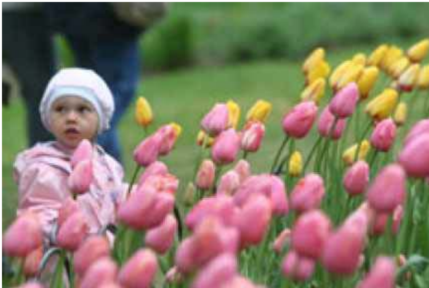
Festival des tulipes