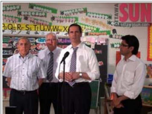
The province will be extending its full-day kindergarten program to 16 Ottawa-area schools starting in the fall of 2011.