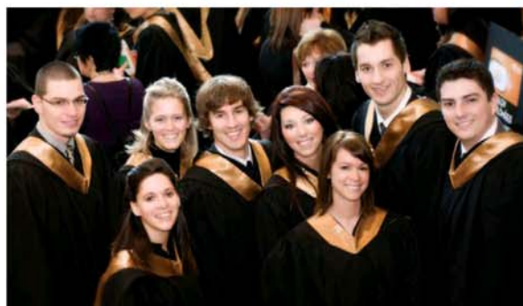
Des sourires qui en disent long pour ces nouveaux diplômés de l'UQO