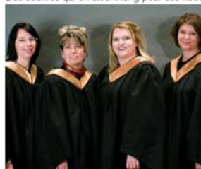
Les 4 premières diplômées du programme d'infirmières praticiennes spécialisées de l'UQO