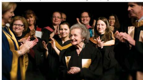
La professeure Brenda Milner applaudie par les dignitaires après l'obtention de son doctorat