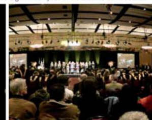
Une cérémonie qui restera gravée dans la mémoire des diplômés et leurs familles