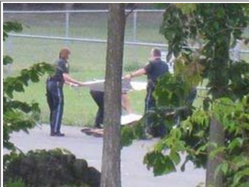
Three OPP officers place a tarp over a moose shot and killed in a Rockland school parking lot this morning.

Another moose has been shot and killed by police in the Ottawa area.