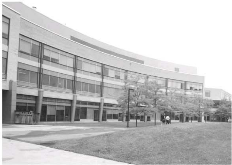
Plus de 4500 étudiants sont inscrits à La Cité collégiale cette année.

«Quand j'ai appris que la Cité ouvrait ses portes en 1990, j'étais très intéressée par le fait français en Ontario, étant moi-même Franco-ontarienne. Ça m'inté-