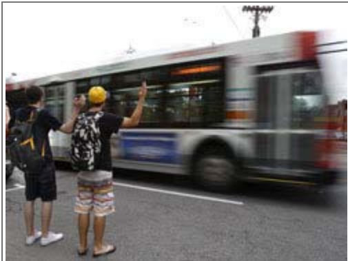
The city's bus union says service will suffer when school starts Tuesday because there aren't enough drivers or buses.

Bus service next week is in jeopardy if OC Transpo covers all the English school board runs it's committed to, the acting head of the city's transit union warned Thursday.