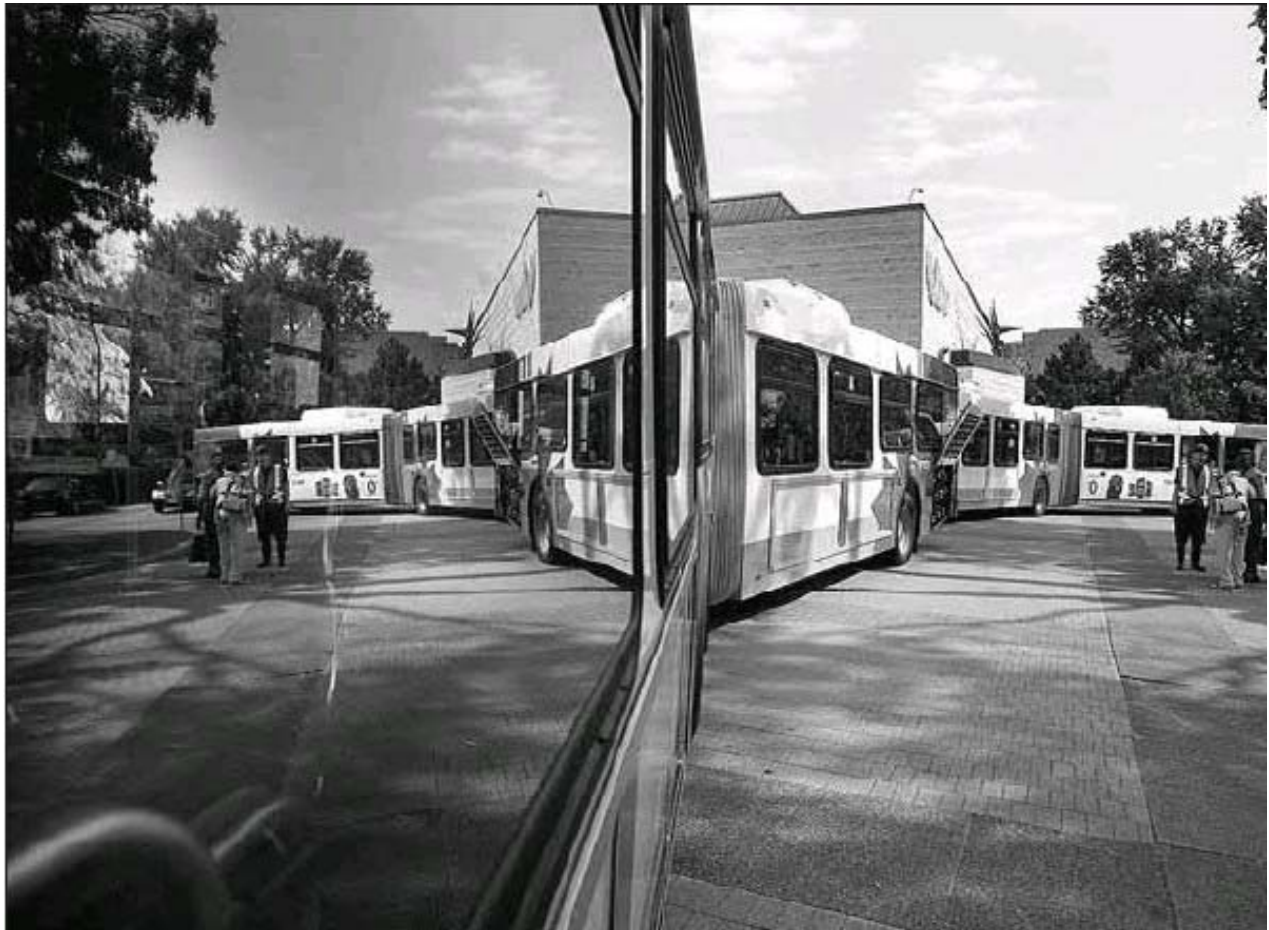
PAT MCGRATH, THE OTTAWA CITIZEN

OC Transpo showcased its new generation of articulated buses at City Hall on Monday. Technological improvements mean better fuel economy and lower atmospheric emissions, fleet engineer Alireza Fattahi-Ghazi said. The buses also include an automated call system to announce stops. Council approved the $155.7-million purchase of 226 buses made available at reduced prices after Chicago delayed a contract with bus maker New Flyer. The entire fleet of new buses should be delivered by early 2011.