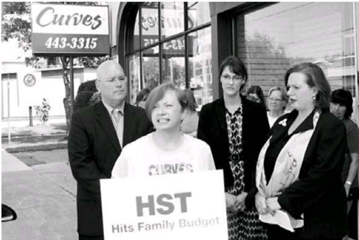
JEAN-FRANÇOIS DUGAS, LeDroit

À 13 mois des élections provinciales en Ontario, le Parti progressiste-conservateur (PCC) a déjà entamé sa campagne dans l'Est ontarien.