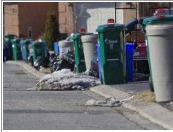
Garbage waits to be picked up in Ottawa. The city will almost certainly go to garbage pickup every two weeks, forcing city residents to turn to recycling.

have far less to put into your regular garbage.