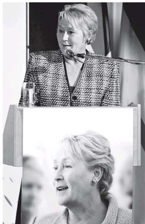
Le Parti québécois n'a pas gagné l'élection hier soir dans Bonaventure, mais Pauline Marois a remporté son pari.