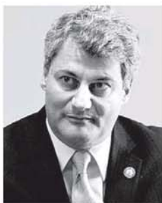
Gérard Deltell, chef de l'ADQ, le grand perdant hier